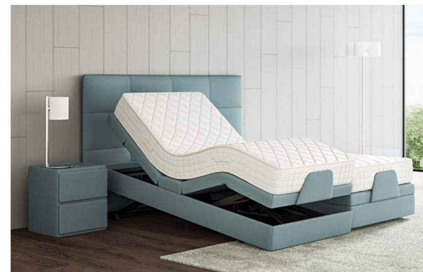
Lit en position inclinée.