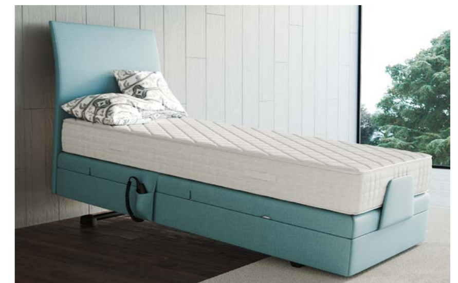
Lit en position inclinée avec tête de lit Rondo.