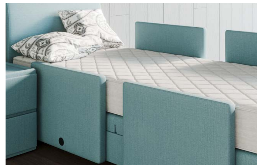
Barrière anti-chute réglable en hauteur.