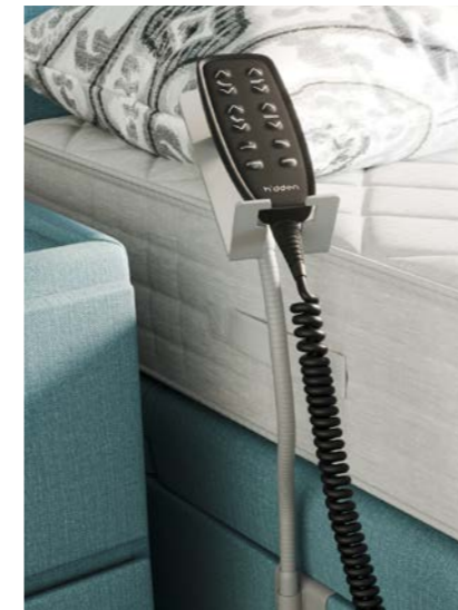
Col de cygne en option.