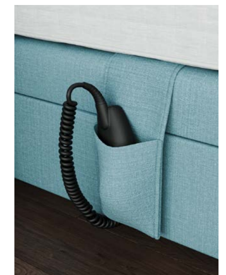
Sac pour la télécommande standard.