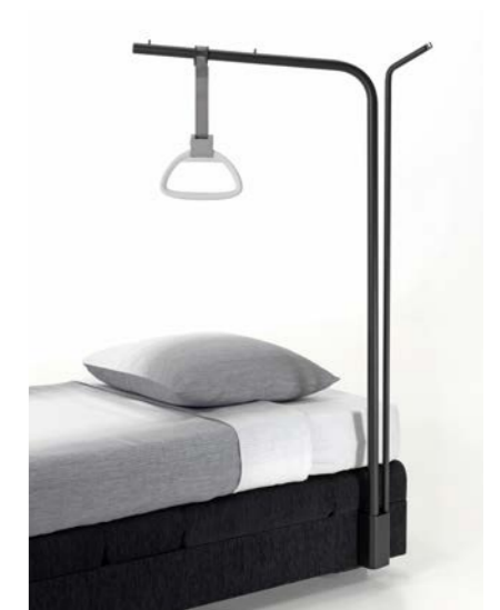
Redresseur avec poignée triangulaire.